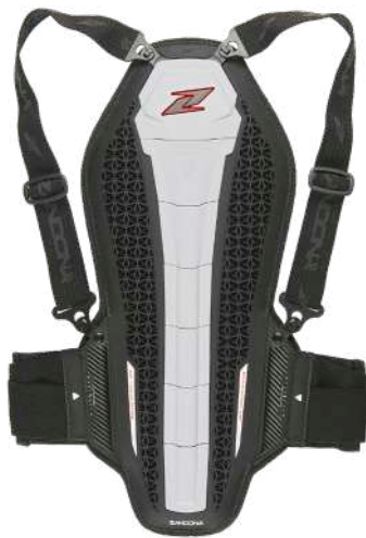
art. 1307 Colour: White