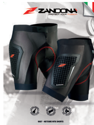
T. Display 6057 art. B90413 Size: A3