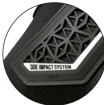
Side Impact System