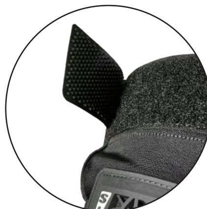
Anti-Stress TPU Strap