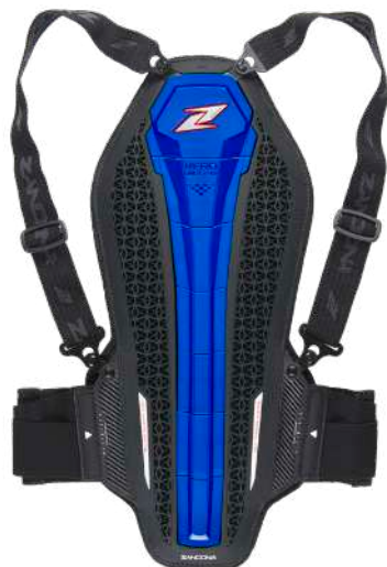
art. 1307 Colour: Blu