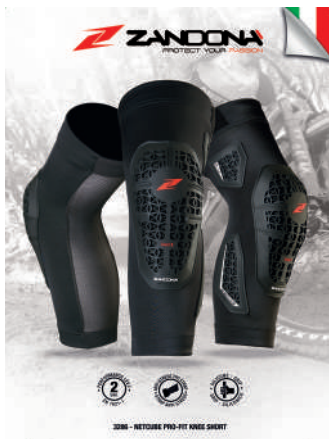
T. Display 3286 art. B90411 Size: A3