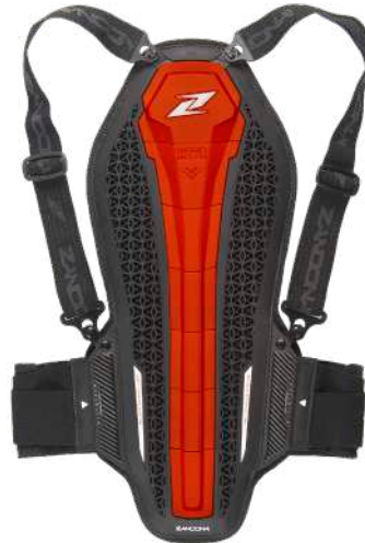
art. 1307 Colour: Red