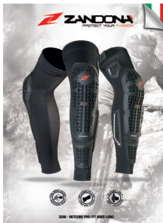
T. Display 3288 art. B90412 Size: A3