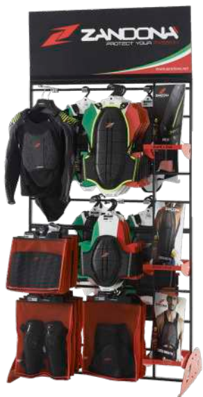
Display Stand Rack art. 9101