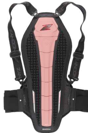
art. 1307 Colour: Pink