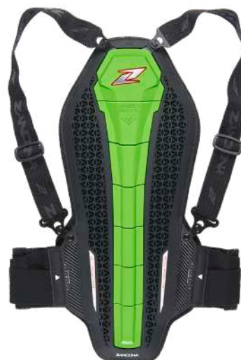
art. 1307 Colour: Green