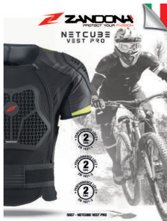
T. Display 5657 art. B90261 Size: A3