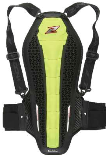
art. 1307 Colour: Yellow